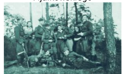
Żołnierze 4. szwadronu 5. Wileńskiej Brygady AK, Białostoczczyzna, lato 1945 r.