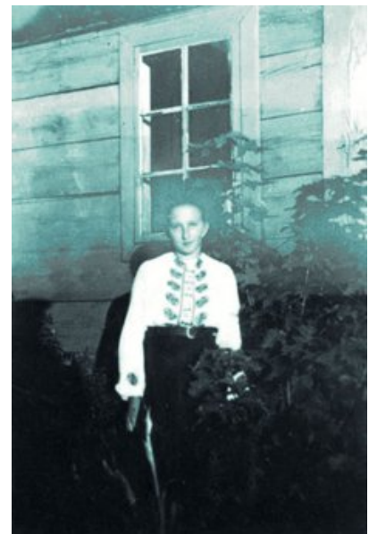
Danuta Siedzikówna „Inka”, Narewka, kwiecień 1945 r.

Śledczy z Wojewódzkiego Urzędu Bezpieczeństwa Publicznego w Gdańsku chcieli od Siedzikówny uzyskać wszystkie informacje na temat działalności oddziału mjr. „Łupaszk” i osób, które im pomagały. By zmusić ją do zeznań, zastraszano ją, poniżano i torturowano, czego świadkami były osoby, które zetknęły się z nią w gdańskim więzieniu.