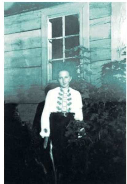
Danuta Siedzikówna „Inka”, Narewka, kwiecień 1945 r.

Śledczy z Wojewódzkiego Urzędu Bezpieczeństwa Publicznego w Gdańsku chcieli od Siedzikówny uzyskać wszystkie informacje na temat działalności oddziału mjr. „Łupaszk” i osób, które im pomagały. By zmusić ją do zeznań, zastraszano ją, poniżano i torturowano, czego świadkami były osoby, które zetknęły się z nią w gdańskim więzieniu.