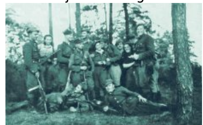
Żołnierze 4. szwadronu 5. Wileńskiej Brygady AK, Białostoczczyzna, lato 1945 r.