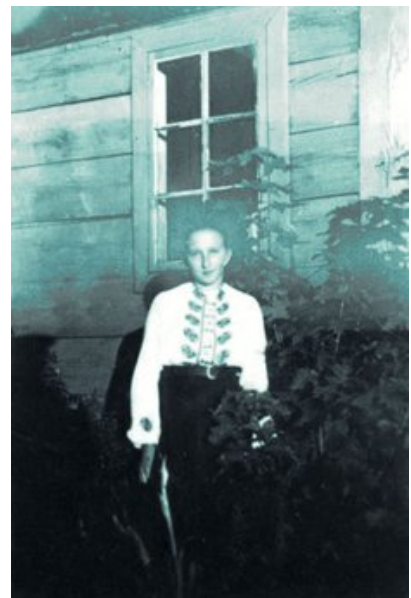
Danuta Siedzikówna „Inka”, Narewka, kwiecień 1945 r.

Śledczy z Wojewódzkiego Urzędu Bezpieczeństwa Publicznego w Gdańsku chcieli od Siedzikówny uzyskać wszystkie informacje na temat działalności oddziału mjr. „Łupaszk” i osób, które im pomagały. By zmusić ją do zeznań, zastraszano ją, poniżano i torturowano, czego świadkami były osoby, które zetknęły się z nią w gdańskim więzieniu.