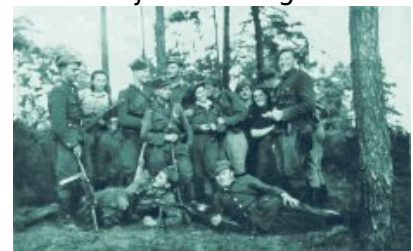
Żołnierze 4. szwadronu 5. Wileńskiej Brygady AK, Białostoczczyzna, lato 1945 r.